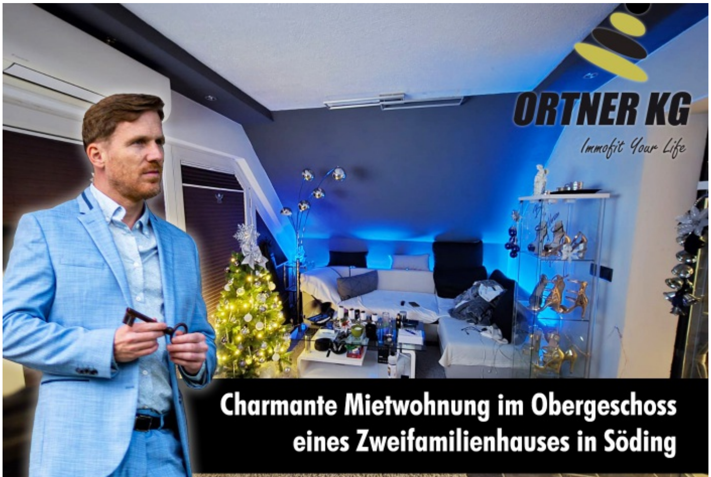
Charmante Mietwohnung im Obergeschoss eines Zweifamilienhauses in Söding